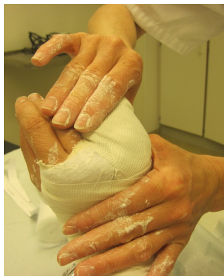
6.Formes i riktig stilling, OBS fingermerker.