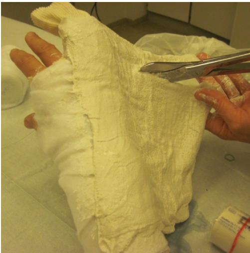
3.Klipp til kalkklasken