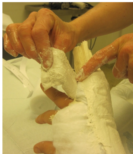
4.Brettes rundt fingrene.