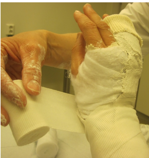
5.Fikseres med elastisk bind.