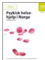
Psykisk helsehjelp i Norge • For voksne, IS-1472 • For ungdom, IS-1474 • Om barn, IS-1473