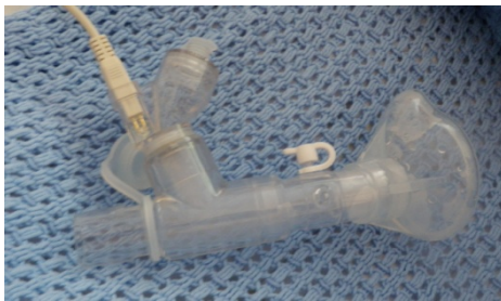
Inhalasjon på tett maske