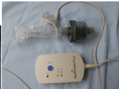
Inhalasjon av antibiotika på maske