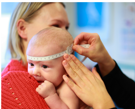
Figur 1 Måling av hodeomkrets.

Ved hver måling bør samme type målebånd benyttes. Målebåndet bør være av god kvalitet, det vil si et bånd som verken kan strekkes eller endre seg over tid. I tillegg bør det være flatt og lett å bøye. Målebånd av glassfiber eller teflon er å foretrekke.