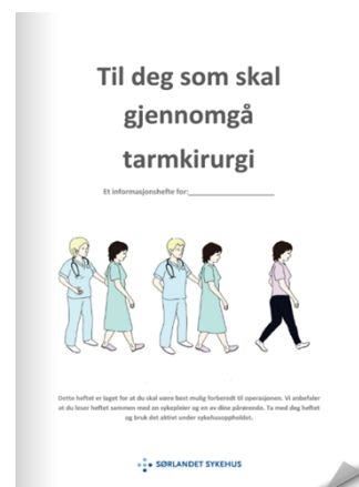
Endetarmskreft med utlagt tarm