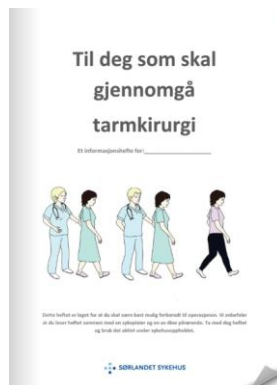
Endetarmskreft med tarmskjøt