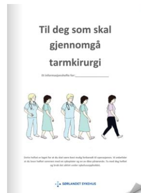
Endetarmskreft med utlagt tarm