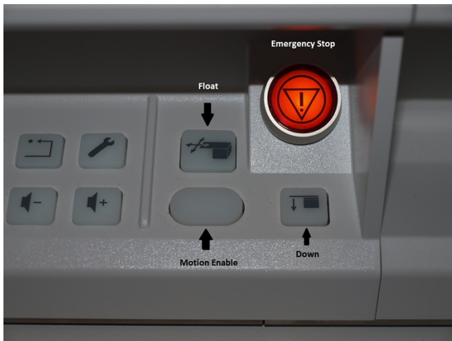
Figur 3: Viser behandlingsbenkens sidepanel, med varians «emergency stop» samt knapper som trengs for å få behandlingsbordet ned i en strømstanssituasjon.