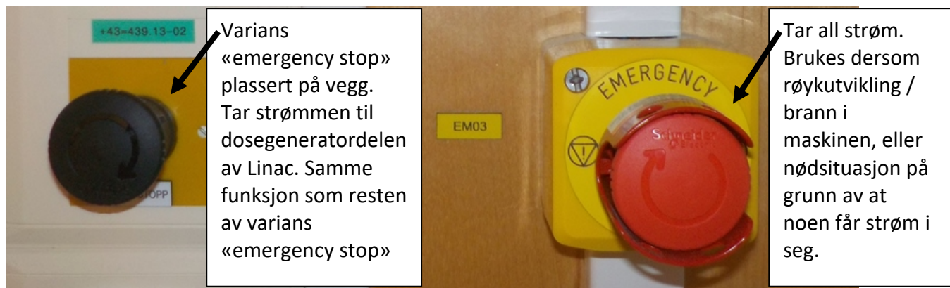
Figur 2: Ulike nødstop på vegg. Plassert i kontrollrom og behandlingsrom. Rød «emergency stop» er også plassert ved inngangsparti til maskinen. Rød «emergency stop» brukes kun i alvorlige nødsituasjoner.