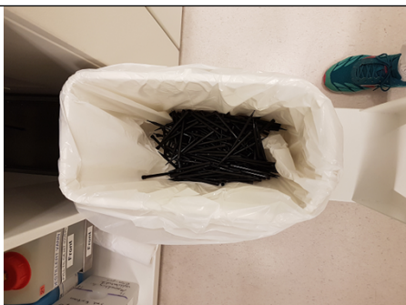
Avfall fra RSA pro= RISIKO