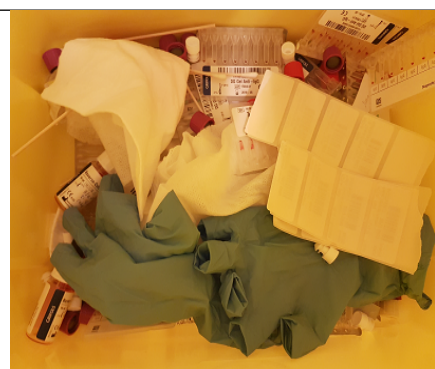
Hansker og gelkort= REST Etiketter= RISIKO