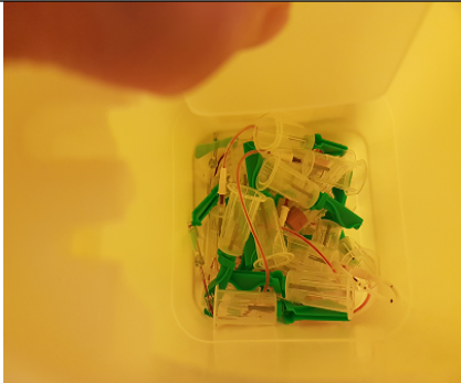
Nåler med holdere= RISIKO

Medisinsk serviceklinikk/Laboratorieavdelingen SSA/Fellesdokumenter lab.avd. SSA/Administrative rutiner