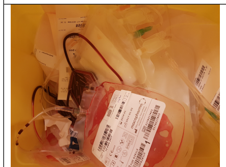
Tomme blodposer = RISIKO