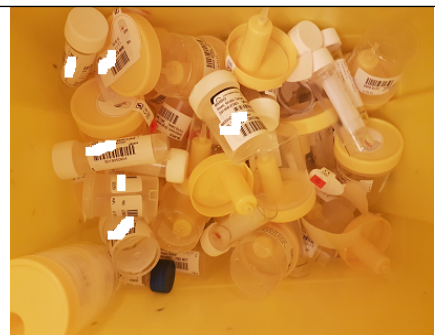
Tomme uringlass= RISIKO