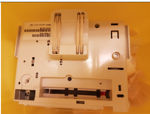
Reagenskassett med nål = RISIKO