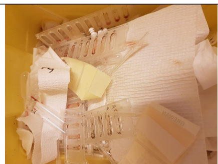
Bioplater, Benkpapir= REST