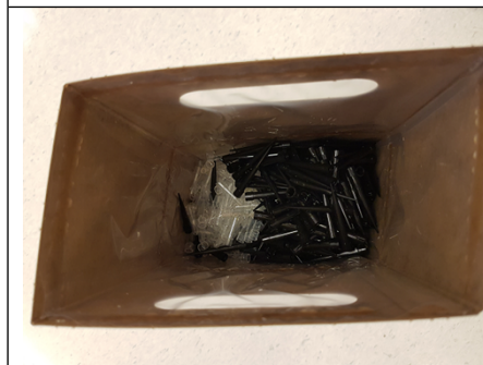
Avfall fra Cobas= RISIKO