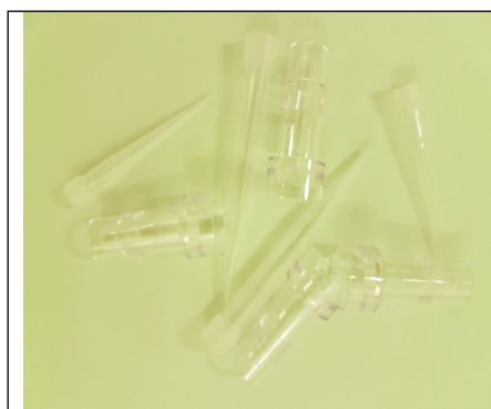
Prøvekopp= REST Tipper= RISIKO

RISIKOAVFALL: Nåler, pipettespisser, alt med pasient ID på, glassflasker/rør , blodposer med blod i, prøverør og sprøyter.