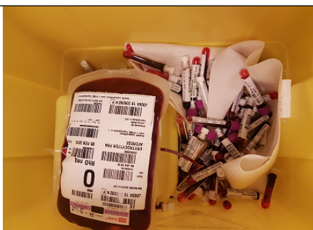
Fuller blodposer = RISIKO