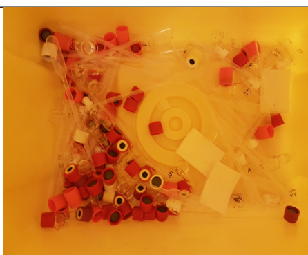
Engangspipetter, korker= REST