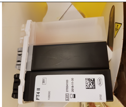
Reagenskassett uten nål = REST