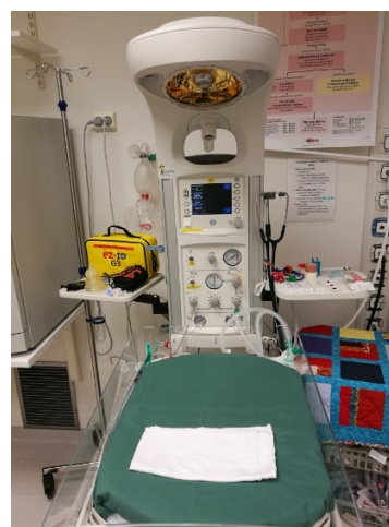
GIRAFFE ASFYXIBORD KLART TIL BRUK, FORB. C