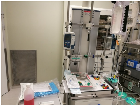
ANESTESIRACK MED SECTIOBAKKE/SPINALBORD ++