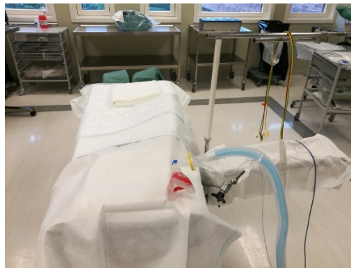
OPERASJONSBORD MED ANESTESI-UTSTYR, KLART TIL BRUK