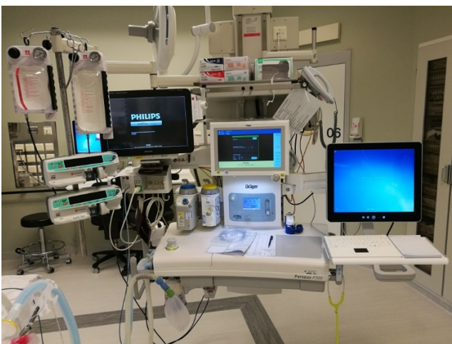
ANESTESIAPPARAT KLART TL BRUK