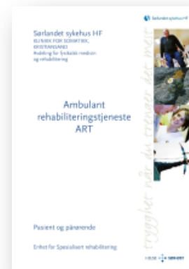
ART – til pasient og pårørende