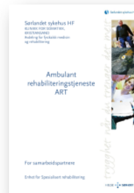
ART – til samarbeidspartnere