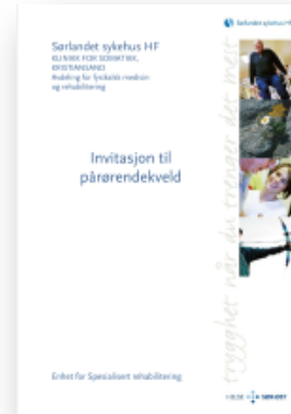
Invitasjon til pårørendekveld