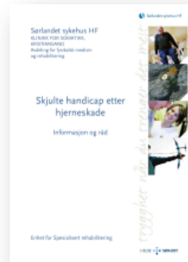
Skjulte handicap etter hjerneskode