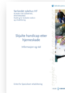
Skjulte handicap etter hjerneskade