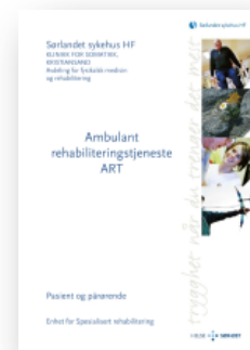
ART – til pasient og pårørende