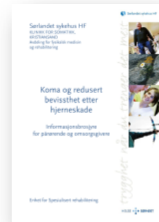
Koma og redusert bevissthet