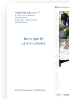
Invitasjon til pårørendekveld