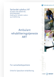
ART – til samarbeidspartnere