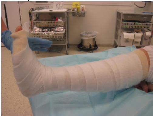
3 Softcast 50% overlapp