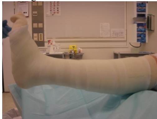
4 Softcast 50% overlapp