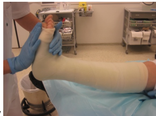
7 Hold et godt trykk på lateral siden, husk 90 grader