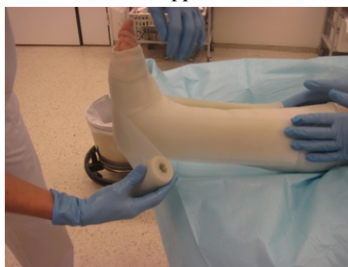
6 Et lag med vætet Softcast kant i kant tilslutt