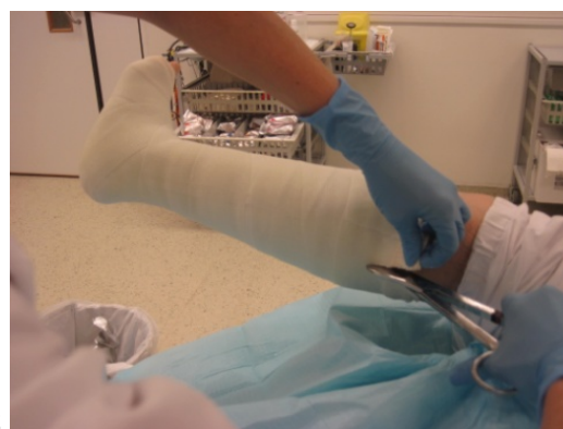
8 Ved gipsfjerning av u-laske er lettest å klippe opp bak, ved L-laske er det lettes å klippe foran