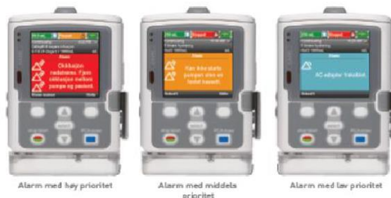
Alarm med høy prioritet

med farge og lyd med høy (rød), middels (gul) og lav (blå) prioritet