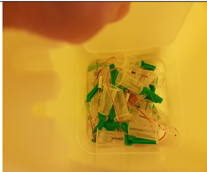
Nåler med holdere= RISIKO

Klinikk for medisinsk diagnostikk og klinisk service/Avd. for medisinsk biokjemi SSA/Fellesdokumenter MedBio SSA/Administrative rutiner