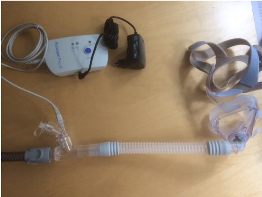
Samme oppsett både for nesemaske og helmaske.